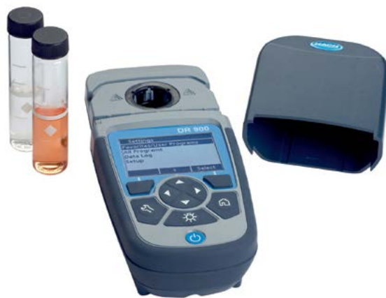
DR 900 со снятой крышечкой и кюветы для образцов

Путем сочетания всех этих характеристик с кнопкой подсветки экрана в условиях слабого освещения мы получаем портативный колориметр, готовый к немедленной работе в полевых условиях, что делает проведение анализов в условиях объектов не такими трудными.